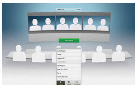
Interface utilisateur intuitive

Total Service — Choix de services garantissant le niveau de maîtrise que vous souhaitez et la sécurité dont vous avez besoin. Source unique couvrant tous les besoins en matière de téléprésence, la gamme complète de services TANDBERG assiste les clients à toutes les étapes, de l'installation et du déploiement aux services de conciergerie en passant par le support. Grâce à une disponibilité 7 jours sur 7 et 365 jours par an, ainsi qu'aux contrats de service garantis, Total Service est un gage de sérénité totale.